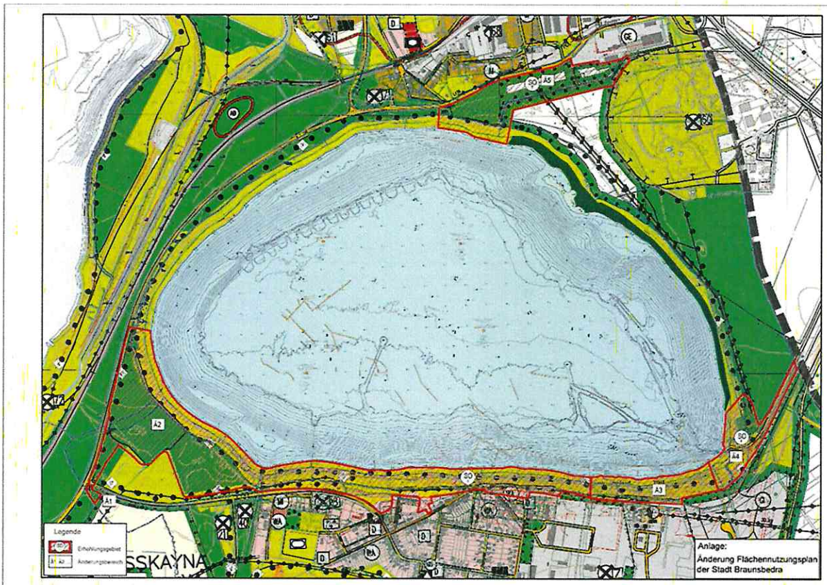
Abb. 1: Änderungsbereiche der 5. Änderung des Flächennutzungsplans der Stadt Braunsbedra (Beschluss vom 22.09.2021)

geschlossen. Das geplante Vorhaben ist in den Änderungsbereichen Ä2 und Ä4 verortet. Im Zuge des Planverfahrens wurden die Änderungsbereiche in Abstimmung mit der Stadt Braunsbedra verändert.